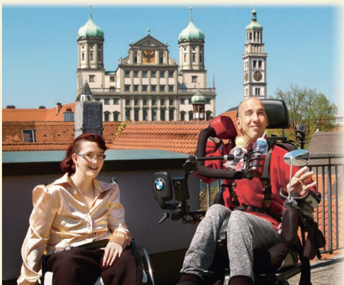
Besonders attraktiv: die Dachterrasse im St. Jakobsstift